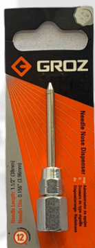
AGUJA PARA ENGRASAR