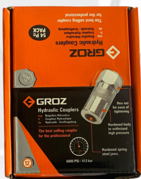
BOQUILLA PARA ENGRASE, GROZ TL