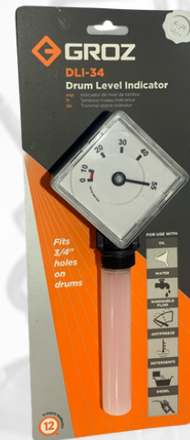
MEDIDOR DE ACEITE PARA BARRIL