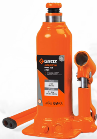
JACK DE BOTELLA DE 2 TONELADAS