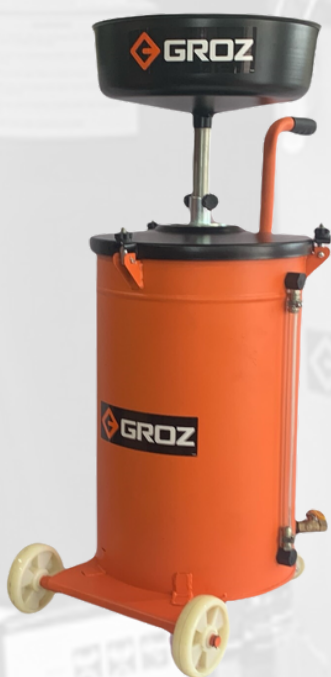
COLECTOR DE ACEITE USADO 13 GALONES