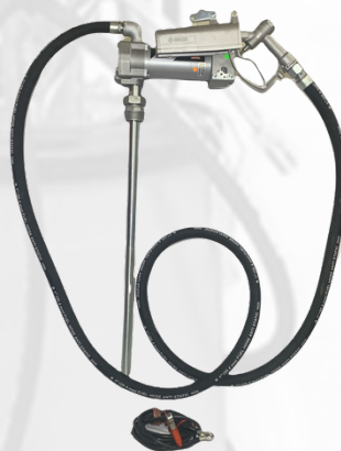
BOMBA PARA COMBUSTIBLE DE 12, 24, 115 VOLTIOS