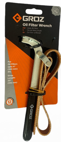
LLAVE PARA FILTRO DE ACEITE DE BANDA AJUSTABLE