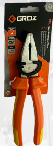
ALICATE COMBIANDO CROMO VANDIO, 1000V, 8"