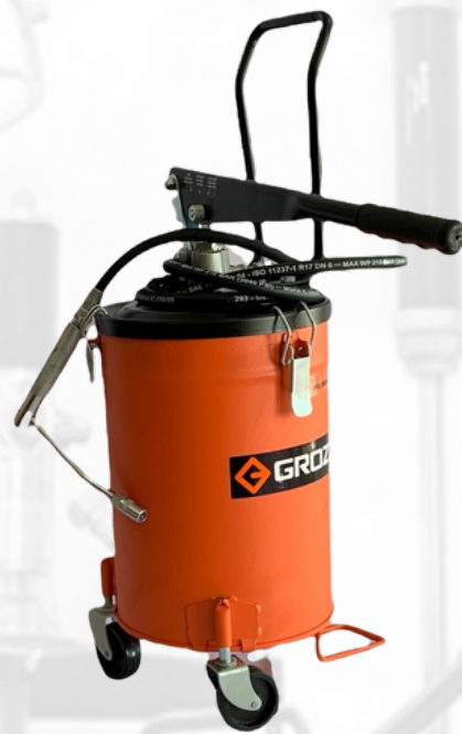
BOMBA ENGRASADORA MANUAL CON DEPOSITO 10 KG