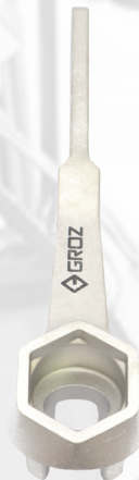
LLAVE PARA QUITAR TAPONES DE BARRILES