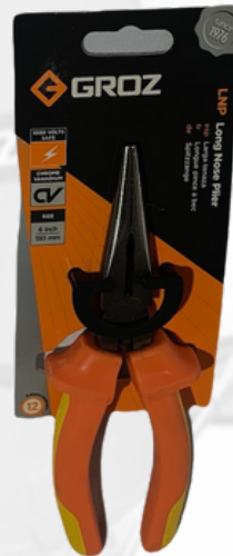
ALICATE PUNTA LARGA, 1000V, 6"