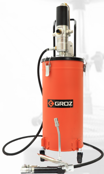
BOMBA ENGRASADORA NEUMATICA CON DEPOSITO DE 15 KG