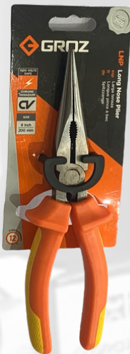
ALICATE PUNTA LARGA, 1000V, 8"