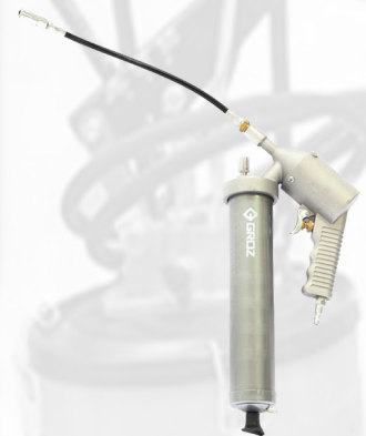
BOMA ENGRASADORA NEUMATICA DE 14 OZ CON EXTENSION FLEXIBLE