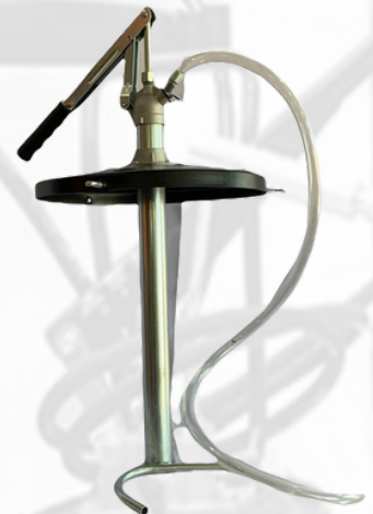
BOMBA MANUAL PARA ACEITE PARA CUBETA 20 LTS