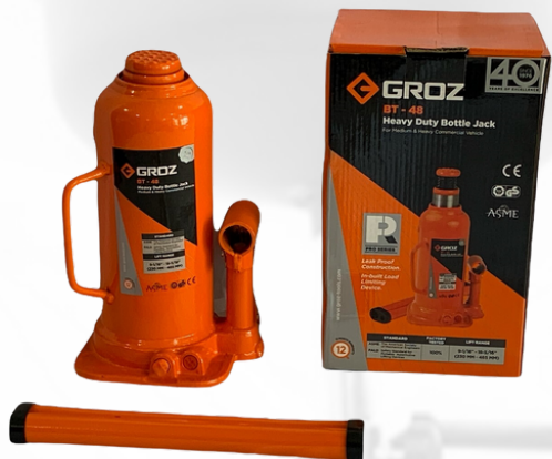
JACK DE BOTELLA DE 12 TONELADAS