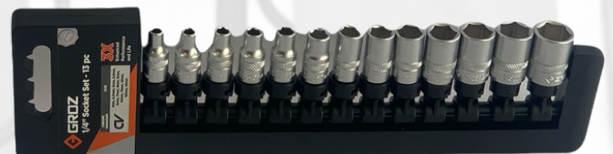
JUEGO DE CUBOS DE 1/4 SOBRE RIEL 13 PIEZAS