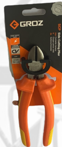
ALICATE DE CORTE LATERAL/DIAGONAL, 6"