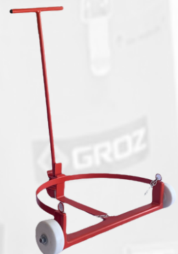
CARRETILLA PARA BARRIL DE 55 GLS