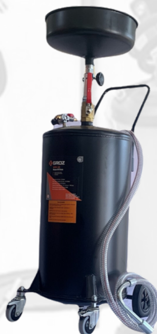
COLECTOR DE ACEITE USADO, CON DRENO PRESURIZADO 18 GALONES