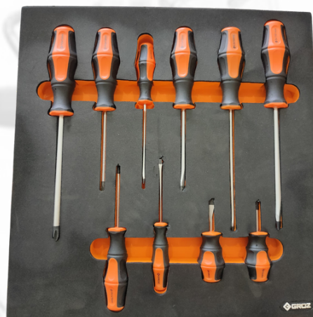
JUEGO DE DESTORNILLADORES SURTIDOS, 10 PCS