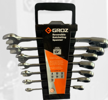
JUEGO DE LLAVES TIPO RATCH 8,10,12,13,14,17,19,MM