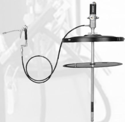
BOMBA ENGRASADORA NEUMÁTICA PARA BARRIL DE 400 LBS