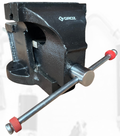
PRENSA FIJA DE 150 MM