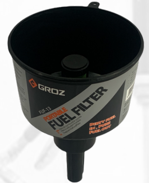
EMBUDO PARA COMBUSTIBLE DE 13LPM