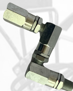
SWIVEL PARA PISTOLA DE ENGRASE