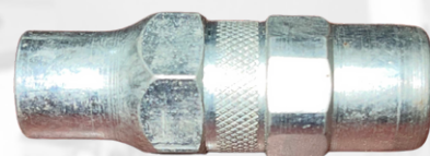
BOQUILLA PARA ENGRASE TIPO PESADO