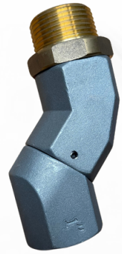
SWIVEL PARA COMBUSTIBLE DE 1"