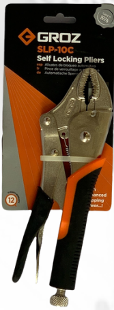
TENAZA DE PRESION DE 10"