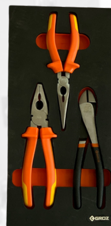
JUEGO DE TENAZAS SURTIDO 3 PCS