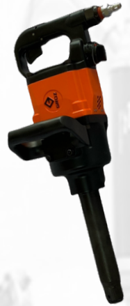
PISTOLA DE IMPACTO DE 1"