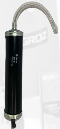
BOMBA MANUAL DE SUCCIÓN TIPO JERINGA