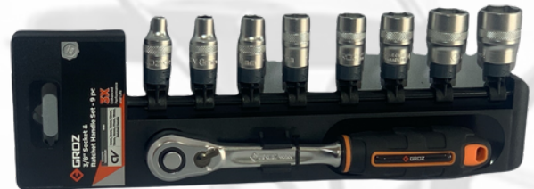
JUEGO DE CUBOS Y RATCH DE 3/8 EN RIEL, 9 PIEZAS