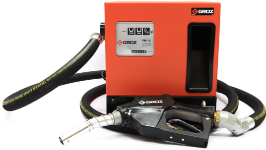
BOMBA DE COMBUSTIBLE TIPO GAVINETE