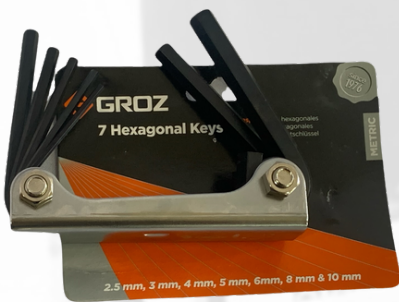
JUEGO DE LLAVES ALEN MILIMETRICAS 7 PIEZAS