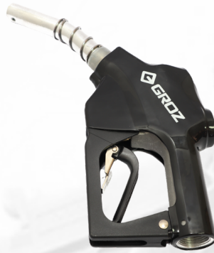
PISTOLA AUTOMÁTICA PARA COMBUSTIBLE DE 3/4 CUELLO GRUESO