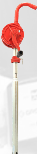
BOMBA ROTATIVA PARA BARRIL