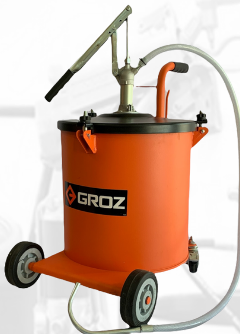
BOMBA MANUAL PARA ACEITE CON DEPOSITO DE 30 LTS