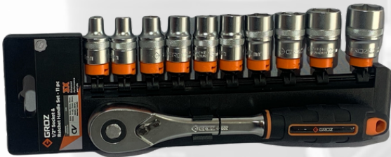
JUEGO DE CUBOS Y RATCH DE 1/2, 11 PIEZAS