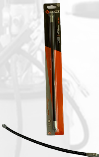
EXTENSION FLEXIBLE DE 18" P/PISTOLA DE ENGRASE