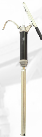
BOMBA MANUAL DE PALANCA, PARA ACEITE CON TUBO TELESCÓPICO