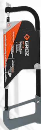
MARCO PARA SIERRA EXTENSIBLE