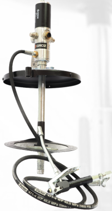
BOMBA ENGRASADORA NEUMÁTICA PARA CUBETA DE 35 LBS