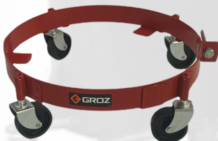
BASE CON RODOS PARA CUBETAS DE 5 GLS