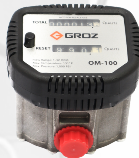
MEDIDOR ANALOGO PARA ACEITE