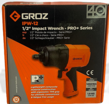
PISTOLA DE IMPACTO DE 1/2