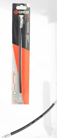
EXTENSION FLEXIBLE DE 12" P/PISTOLA DE ENGRASE