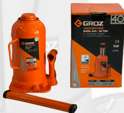
JACK DE BOTELLA DE 20 TONELADAS