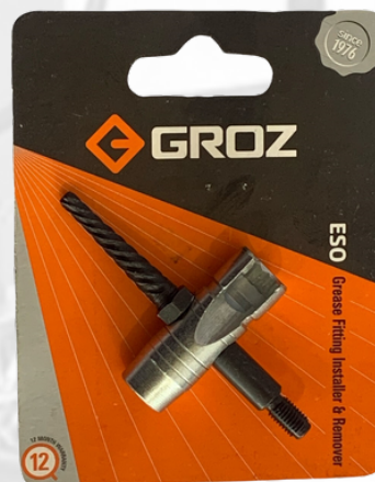
TARRAJAS PARA GASERAS DE 1/4 Y 1/8