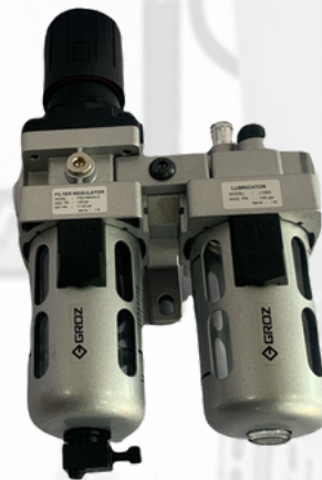
FRL PARA LINEA DE AIRE DE 1/2 NPT