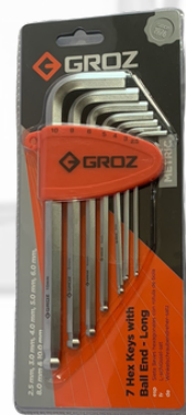
LLAVES ALEN MM 2.5 MM- 10MM, 7 PCS