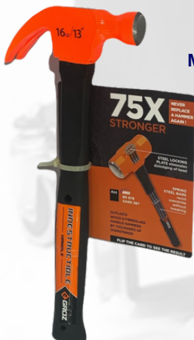
MARTILLO DE OREJAS CON MANGO DE 13\"/>