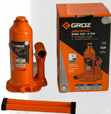
JACK DE BOTELLA DE 4 TONELADAS