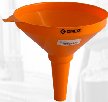
EMBUDO PLASTICO CAPACIDAD 1.8LTS