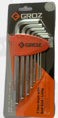
LLAVES ALEN SAE 3/32- 3/8, 7 PCS