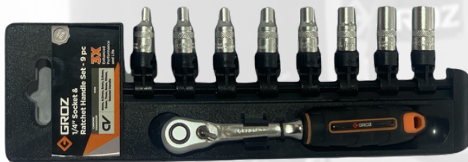
JUEGO DE CUBOS Y RATCH DE 1/4 EN RIEL, 9 PIEZAS