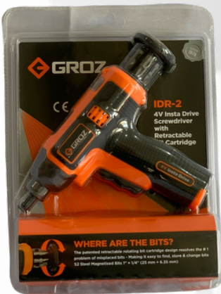
DESTORNILLADOR INALAMBRICO 4V