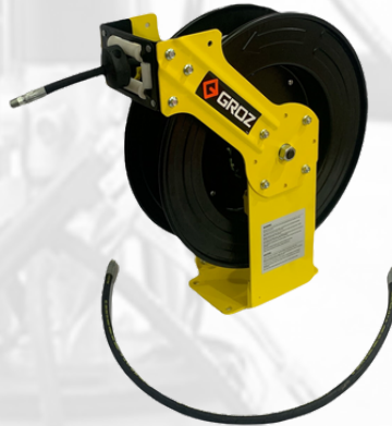
CARRETE PARA GRASA DE 1/4 POR 15 MTS