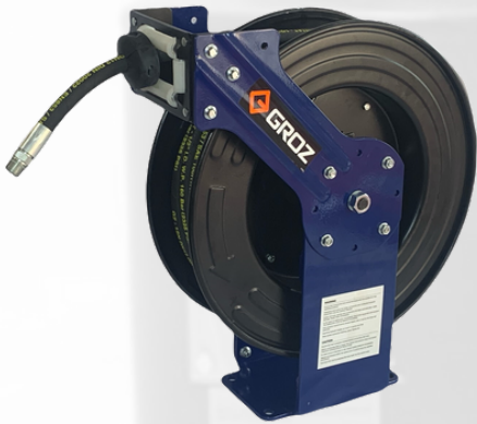
CARRETE AUTOMÁTICO PARA ACEITE DE 1/2 POR 15 MTS