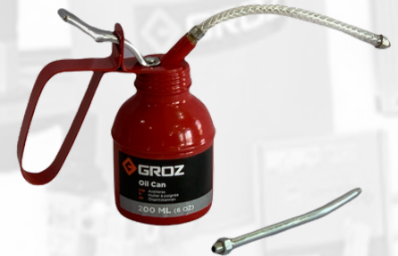
ACEITERA DE 200 ML CON EXTENSION FLEXIBLE