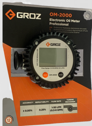
MEDIDOR DIGITAL PARA ACEITE DE 1" NPT