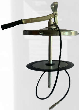
BOMBA ENGRASADORA MANUAL PARA CUBETA DE 20 KG