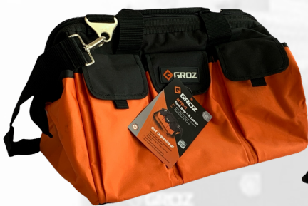
MALETÍN PARA HERRAMIENTAS CAPACIDAD 60 KGS Y 30 KGS