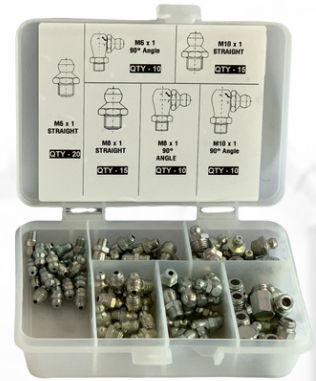
JUEGO DE 80 GRASERAS EN PULGADAS