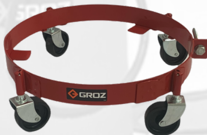
BASE CON RODOS PARA BARRIL DE 120 LBS