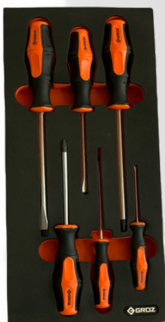
JUEGO DE DESTORNILLADORES SURTIDOS 6 PCS