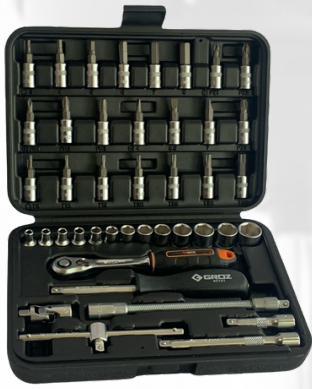
JUEGO DE CUBOS Y RATCH DE 1/4 DE 42 PIEZAS