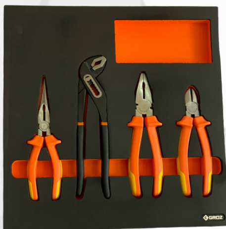
JUEGO DE TENAZAS SURTIDO, 4PCS