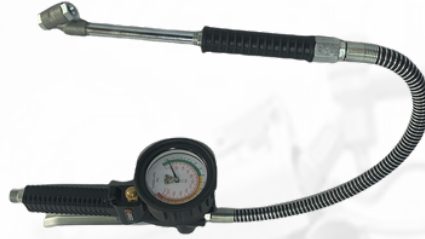
CALIBRADOR ANALOGO PARA LLANTAS