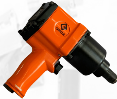
PISTOLA DE IMPACTO DE 3/4