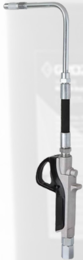
PISTOLA PARA ACEITE DE 1/2 CON BOQUILLA MANUAL