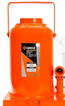
JACK DE BOTELLA DE 50 TONELADAS