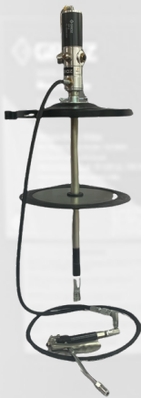
BOMBA ENGRASADORA NEUMÁTICA PARA BARRIL DE 120 LBS