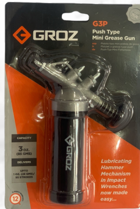
MINI ENGRASADORA MANUAL, 3 OZ.