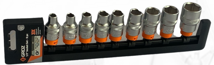
JUEGO DE CUBOS DE 1/2 SOBRE RIEL 9 PIEZAS