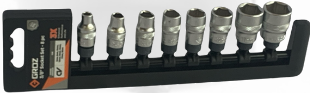
JUEGO DE CUBOS DE 3/8 SOBRE RIEL 8 PIEZAS