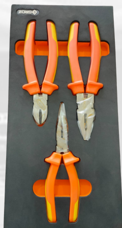
JUEGO DE CORTADOR, TENAZA Y PINZA