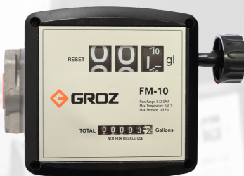
MEDIDOR ANALOGO DE COMBUSTIBLE DE 1" NPT