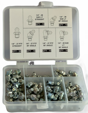
JUEGO DE 80 GRASERAS MILIMETRICAS