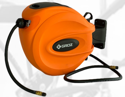
CARRETE PARA AGUA Y AIRE DE 3/8 Y 1/2 X 15 MTS