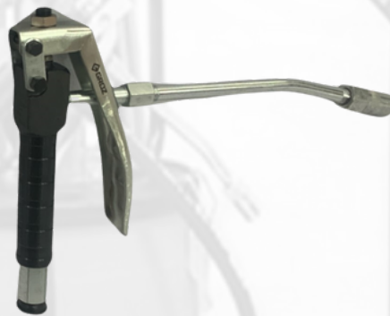
PISTOLA PARA ENGRASE DE 1/4 NPT