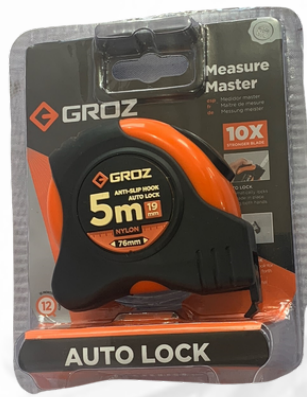
CINTA MÉTRICA DE 5MTS