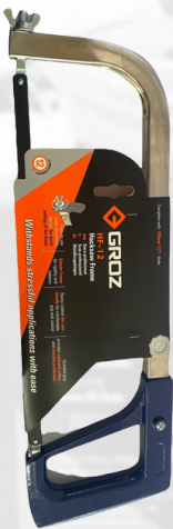
MARCO DE SIERRA PROFESIONAL (CROMO AZUL)