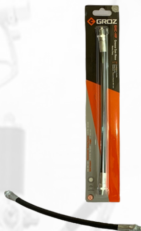
EXTENSION FLEXIBLE DE 12" P/PISTOLA DE ENGRASE