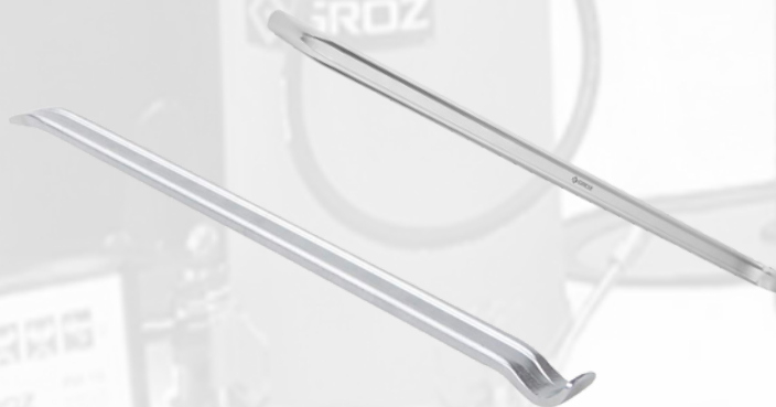
PALANCA PARA DESARMAR NEUMATICOS DE 21" Y DE 24"