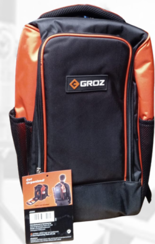
BOLSÓN PARA HERRAMIENTAS