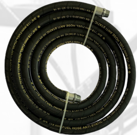
MANGUERA PARA COMBUSTIBLE DE 3/4 Y 1" POR 14 PIES