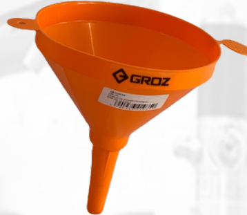
EMBUDO PLASTICO CAPACIDAD 650ML