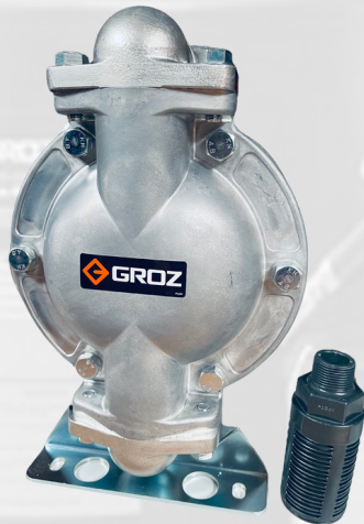
BOMBA DE DIAFRAGMA DE 1" NPT