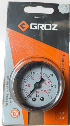
MANOMETRO DE 1/8 NPT MARCA GROZ