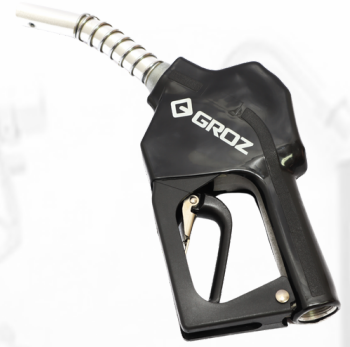
PISTOLA AUTOMÁTICA PARA COMBUSTIBLE DE 1"