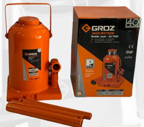
JACK DE BOTELLA DE 32 TONELADAS