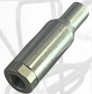
BOQUILLA ANTIGOTEO AUTOMATICA