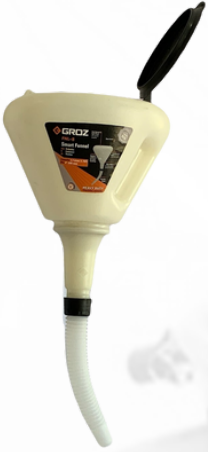
EMBUDO PLASTICO CON EXTENSION Y TAPADERA CAPACIDAD 1.7 LTS