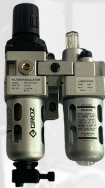
FRL PARA LINEA DE AIRE DE 1/4